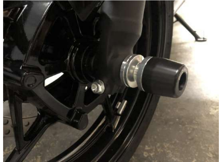
進行方向に対して左側