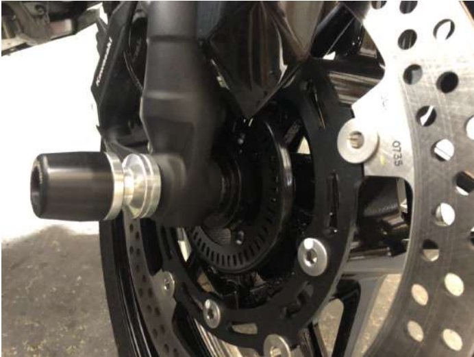
進行方向に対して右側