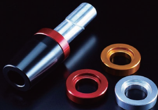
商品は左右セットです (カラーは 1 色のみ付属です)