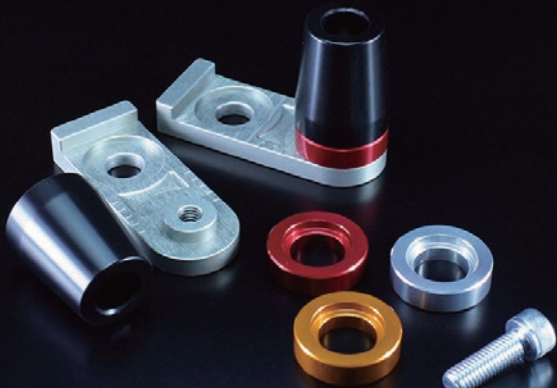
商品は左右セットです (カラーは 1 色のみ付属です)