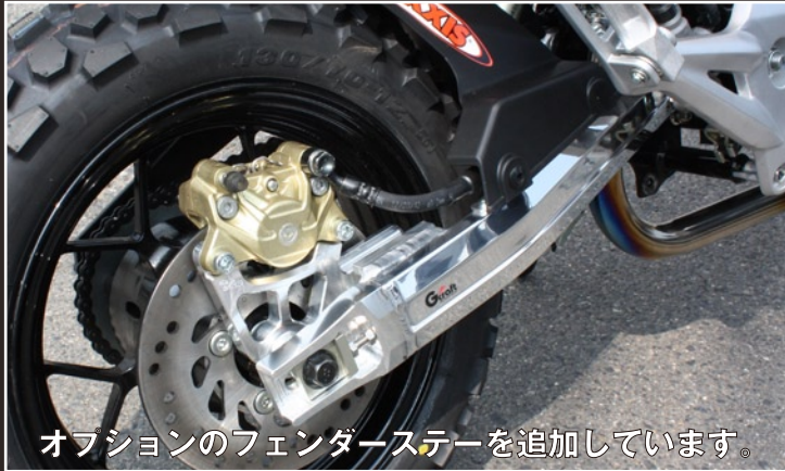
オプションのフェンダーステーを追加しています。