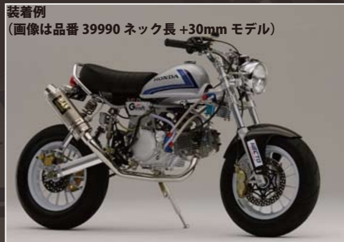
装着例 (画像は品番 39990 ネック長 +30mm モデル)

[39975] GC-020専用OP ダウンチューブ取り付けステー加工 JAN.4522285399755 ¥3,150 GC-020に39921 ダウンチューブを装着するステーを溶接する加工です。 ※39973 オイルクーラー取付ステー加工との同時加工不可。(注文時オプション)