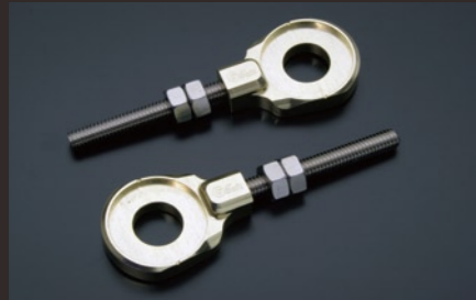
[38500]チェーンアジャスター ハード JAN.4522285385000 ¥3,990 A2017材/SUS