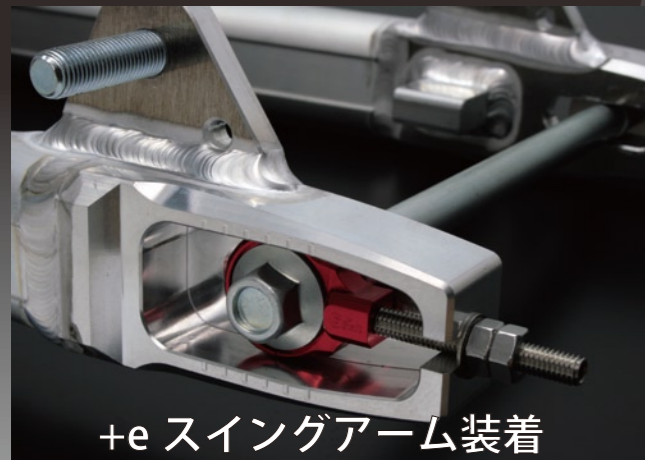
+e スイングアーム装着