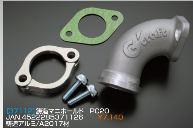
[37112]鋳造マニホールド PC20 JAN.4522285371126 ¥7,140 鋳造アルミ/A2017材