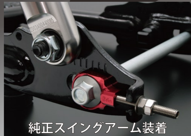
純正スイングアーム装着

モンキー、ゴリラ等の純正スイングアームに使用できる、純正タイプのアルミ削りだしチェーンアジャスターです。弊社 +e スイングアームにも装着可能です。純正スイングアームにも、アクセントを付けることができます。