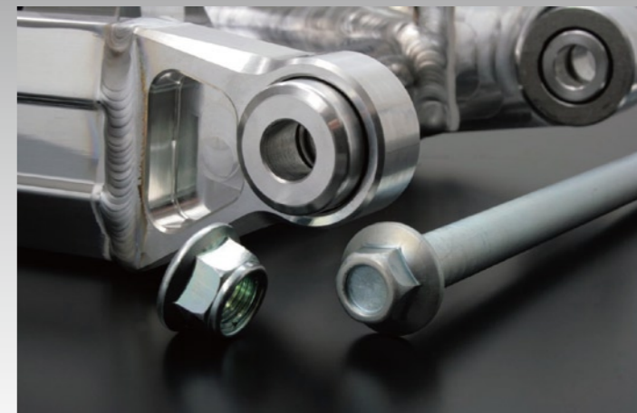
[60902]φ12仕様 スイングアームオプション JAN.4522285609021 ¥3,150

GC-019 フレームのピボット部分をφ12仕様にするオプションです。フレームとの同時注文時のみのオプションです。