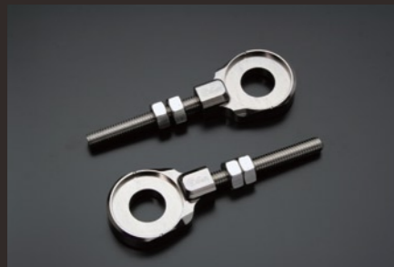
[38503]チェーンアジャスター ガンメタ JAN.4522285385031 ¥2,940 A2017材/SUS