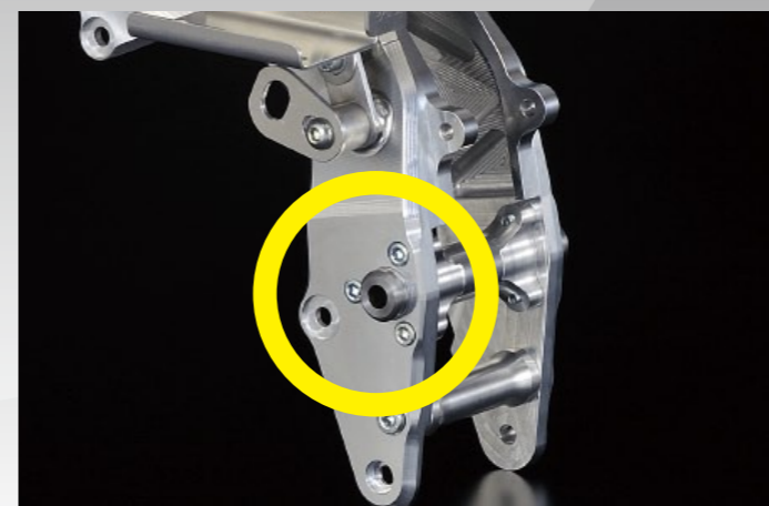
[39968]φ12仕様 フレームオプション JAN.4522285399687 ¥0

GC-019 フレームのピボット部分をφ12仕様にするオプションです。フレームとの同時注文時のみのオプションです。