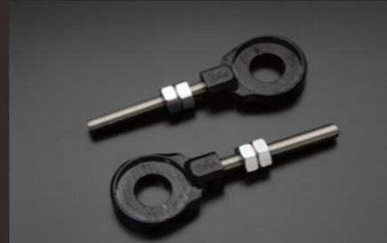
[38502]チェーンアジャスター ブラック JAN.4522285385024 ¥2,940 A2017材/SUS