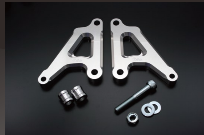
[39969]GC-019用SSS取付アダプター JAN.4522285399694 ¥12,600

GC-019 フレームにシングルサイドスイングアームを装着するためのアダプターです。