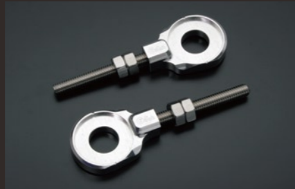
[38501]チェーンアジャスター シルバー JAN.4522285385017 ¥2,940 A2017材/SUS