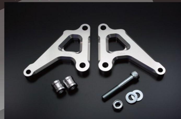
[39970]GC-019用モノショックS/A取付アダプター JAN.4522285399700 ¥12,600

GC-019 フレームに従来のモノショックスイングアームを装着するためのアダプターです。従来品が使用できるので、コストを抑えて GC-019 をお求めいただけます。