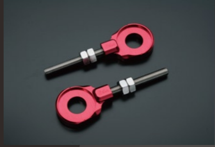
[38504]チェーンアジャスター レッド JAN.4522285385048 ¥2,940 A2017材/SUS