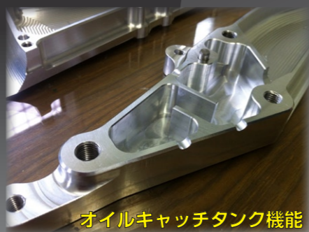
オイルキャッチタンク機能