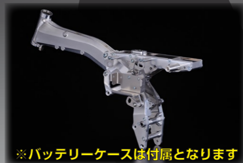
※バッテリーケースは付属となります

●モンキーのディメンションを大きく変更することで、走って楽しめるをコンセプトにフレーム設計しました。 ●メインフレームはモノカ形状によるモノコック構造を採用し、従来のアルミフレームよりも高い剛性を実現しています。GC-019 フレームが描く、そのシンプルながらもキレイな曲線は、今までのアルミフレームのデザインとは一線を画します。モンキーフレームのディメンションをすべて見直し、10インチ、12インチカスタム車に最適な設計になっています。