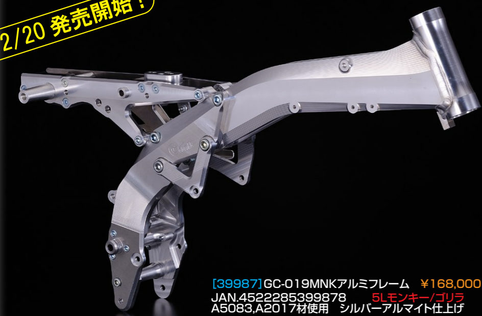
[39987] GC-019MNKアルミフレーム ¥168,000 JAN.4522285399878 5Lモンキー/ゴリラ A5083,A2017材使用 シルバーアルマイト仕上げ