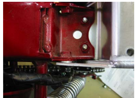
フレーム上部から見た図