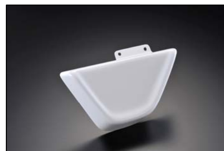
33427 左サイドカバー 価格:5.250 円