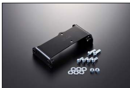
33428 サイドカバー取り付けステー 価格:2.100 円