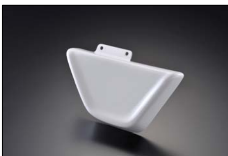
33426 右サイドカバー 価格:5.250 円