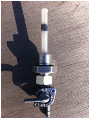
M14 コック側 P1.0 M18 タンク側 P1.5

② アダプター本体にコックを取り付けます。 ここではまだ仮止めにしておいてください。